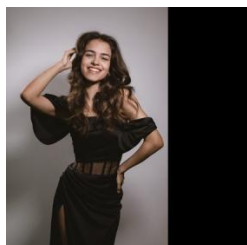
Онлайн-голосование за претенденток на звание «Мисс РГУ 2024»