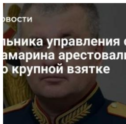
Главного связиста российских войск Шамарина арестовали по делу о взятке